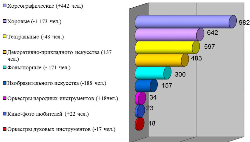
Жанровая структура народного творчества

Лидирующую позицию в структуре художественного самодеятельного народного творчества по-прежнему занимает хореографический жанр: 982 коллектива (20,2%) и 16 333 участников (26,6%). В сравнении с 2016 г. количество коллективов увеличилось на 3 единицы, а число участников на 442 человек.